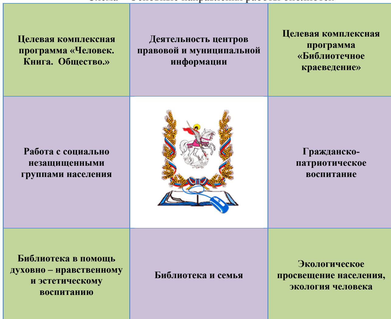
Схема – Основные направления работы библиотек

План культурно-просветительных мероприятий МКУК «МЦБС ГГО» приведен в приложении.