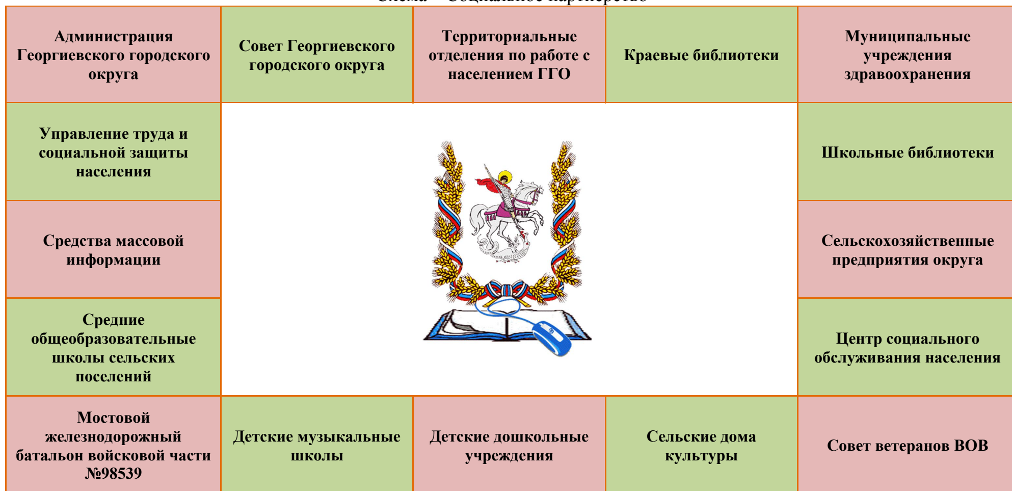
Схема – Социальное партнерство