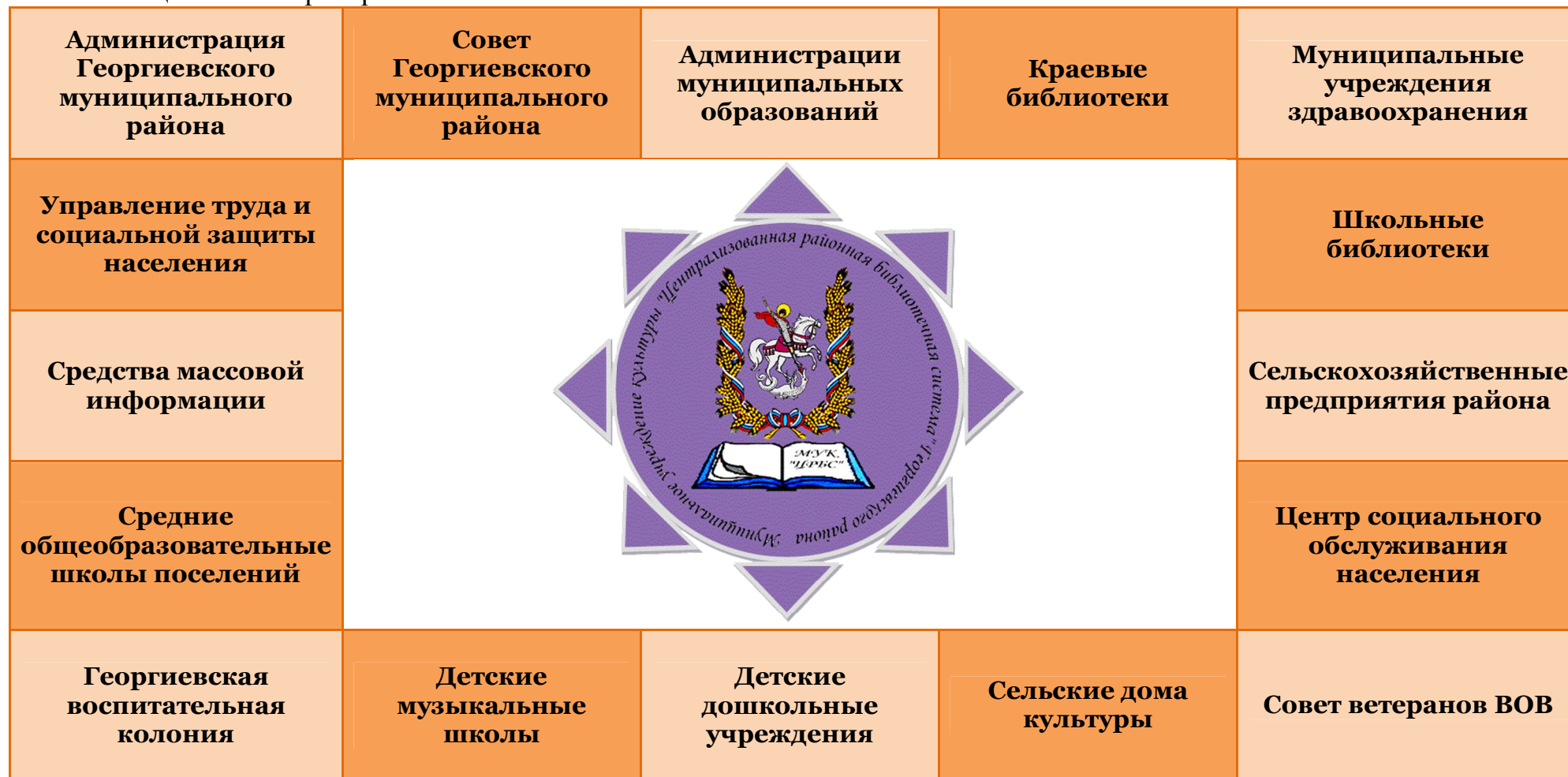
Схема – Социальное партнерство