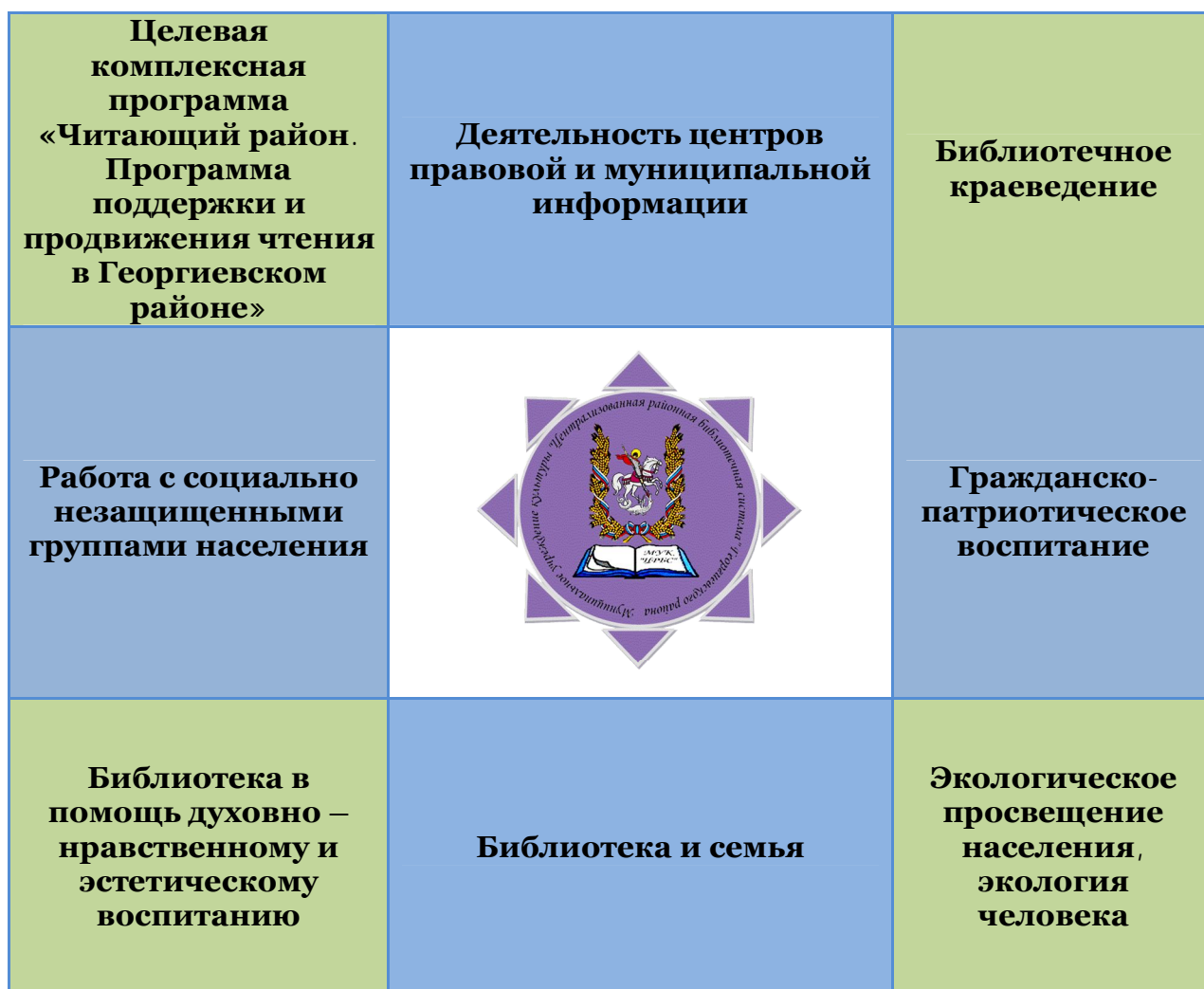
Схема – Основные направления работы библиотек

Полный план мероприятий МКУК ЦРБС по основным направлениям приведен в приложении 2.