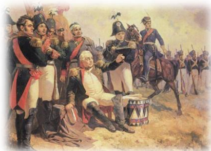
200 лет Победы России в Отечественной войне 1812 года