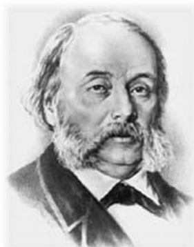
200 лет со дня рождения Гончарова Ивана Александровича