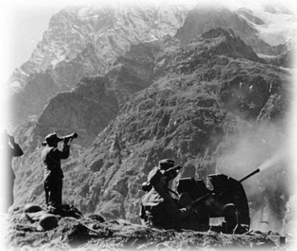
70 лет со дня начала битвы за Кавказ