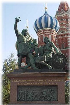
400 лет со дня завершения освобождения Москвы от польских интервентов